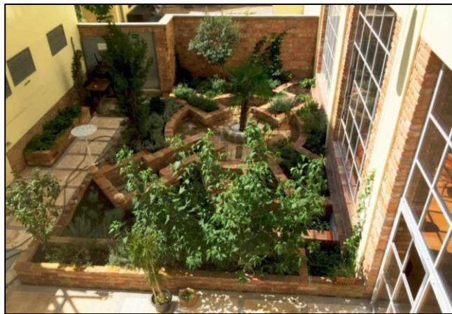
Innenhof GRAND LOFT

Wichtig ist uns ein respektvoller und nachhaltiger Umgang mit Umwelt, Tier & Mensch. Nicht ohne Grund ist in unserem Logo das Friedenszeichen, welches nicht nur als der Gegenpol von Krieg gesehen werden soll, sondern auch als ein Zeichen für Harmonie mit der gesamten Umwelt. Und das spürt man auch im FILMQUARTIER.